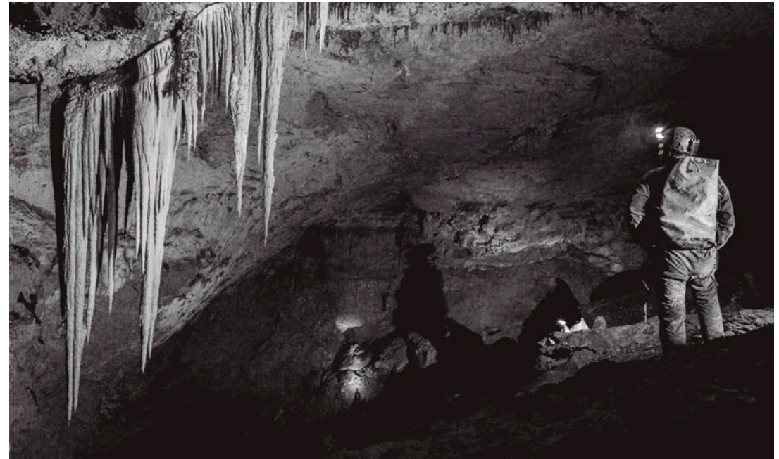
Pagatzako salako espeleotemak.