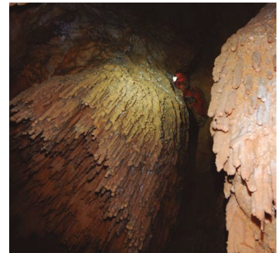
Pagatzako salako espeleotemak.